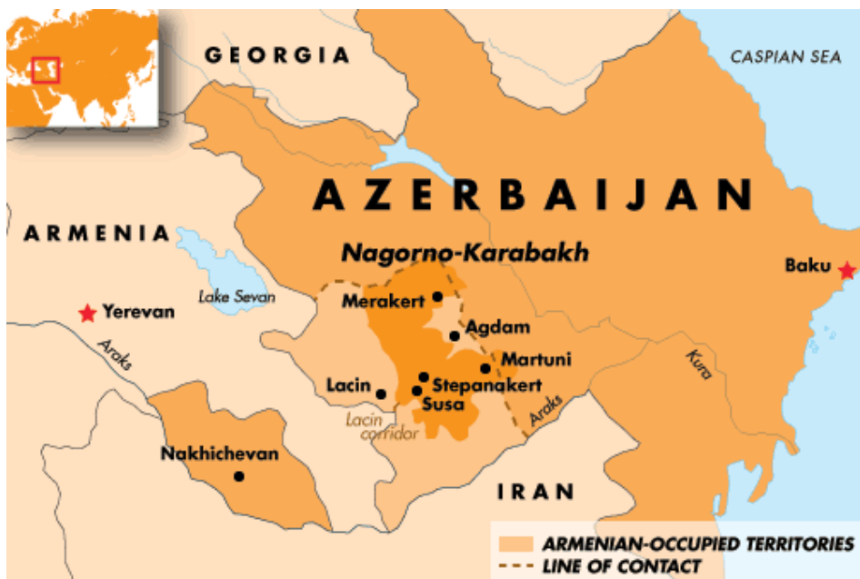
Карта на Нагорно-Карабахския конфликт