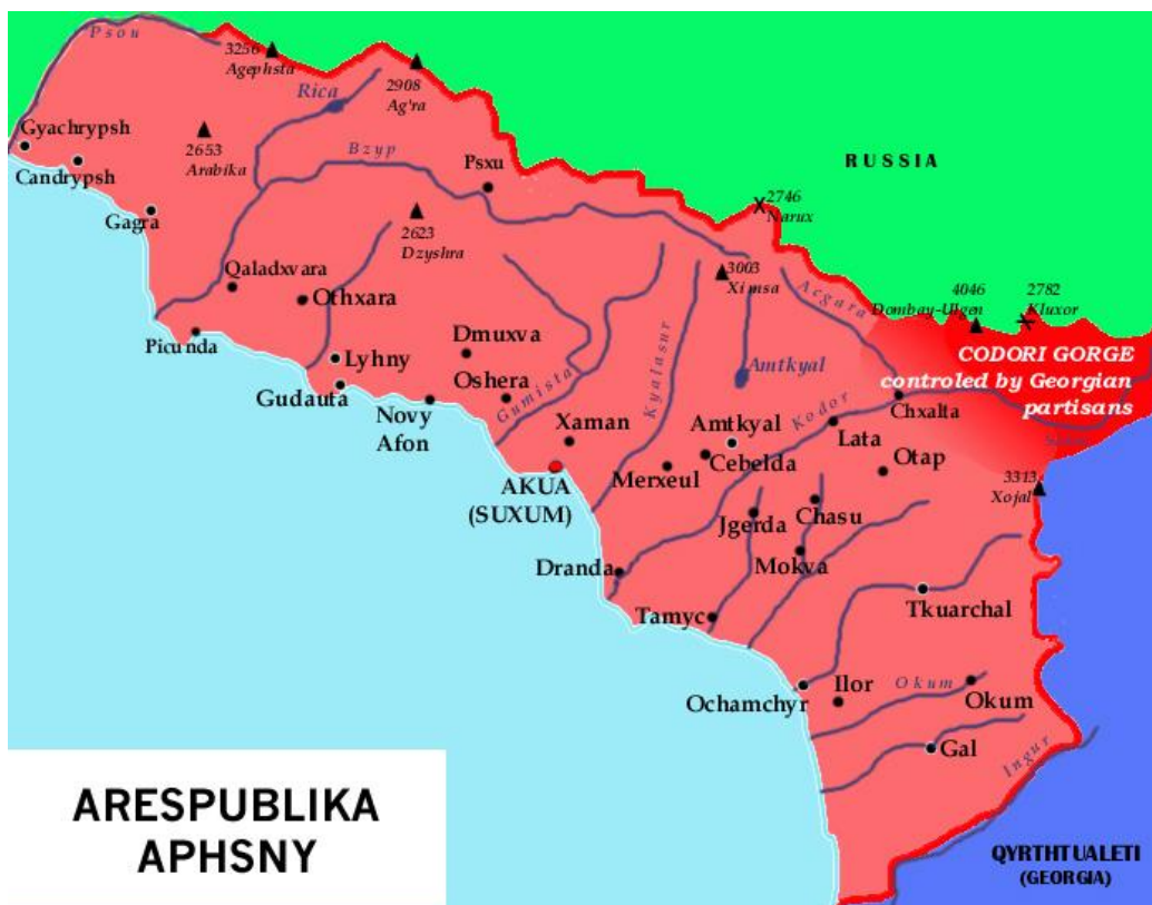
Карта на Грузия