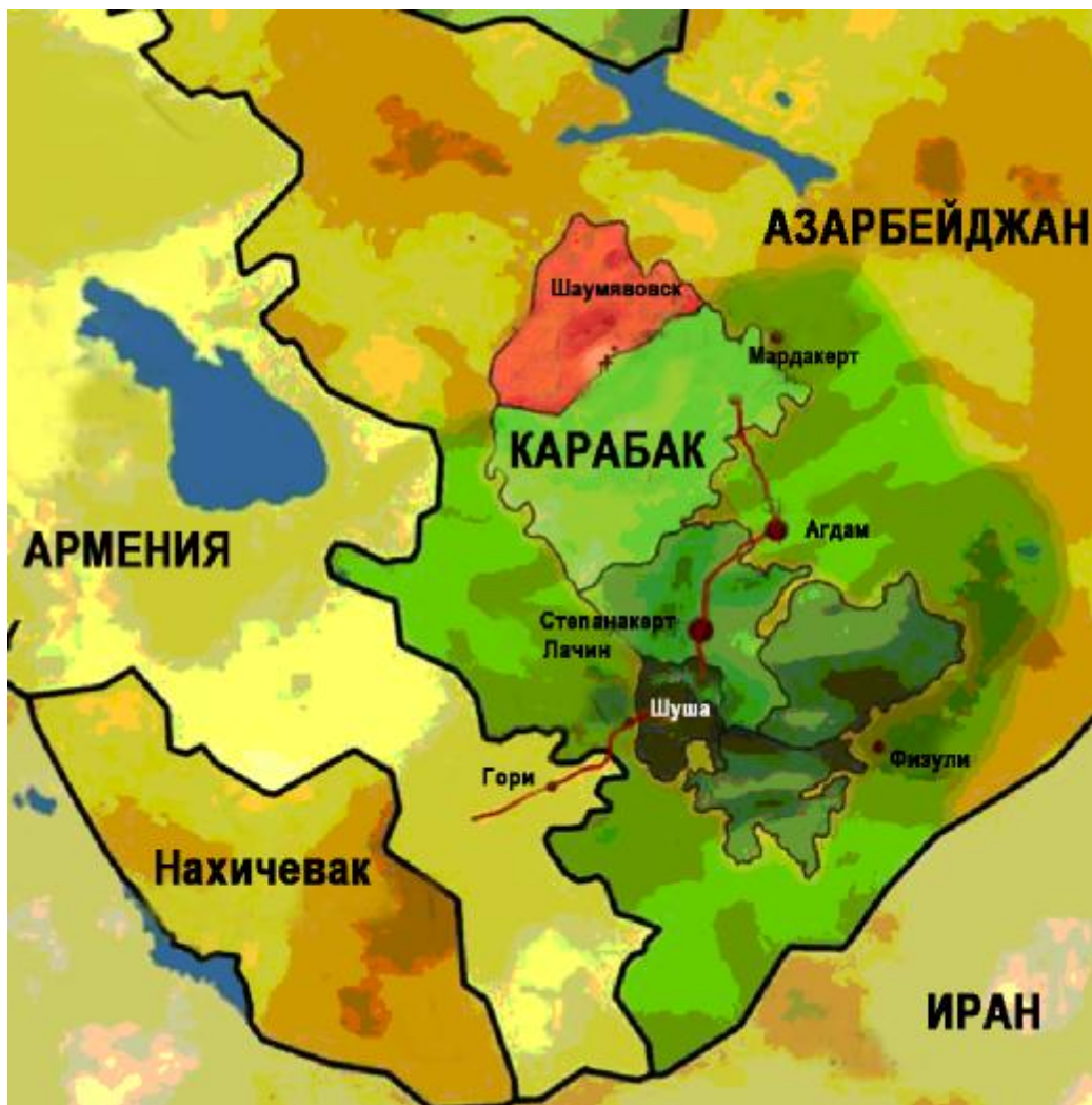
Карта на Нагорни Карабах