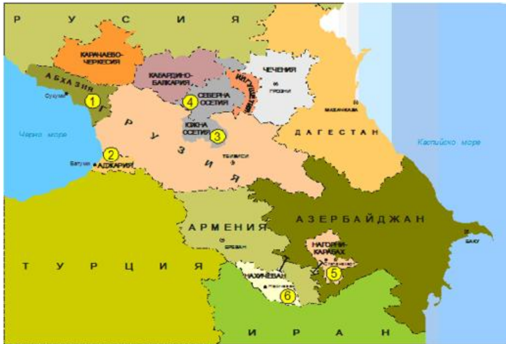
Карта на Кавказ