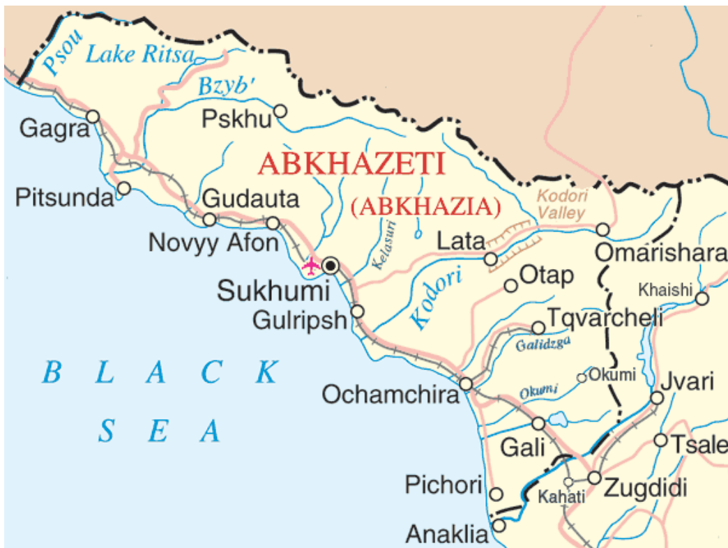
Карта на Абхазия