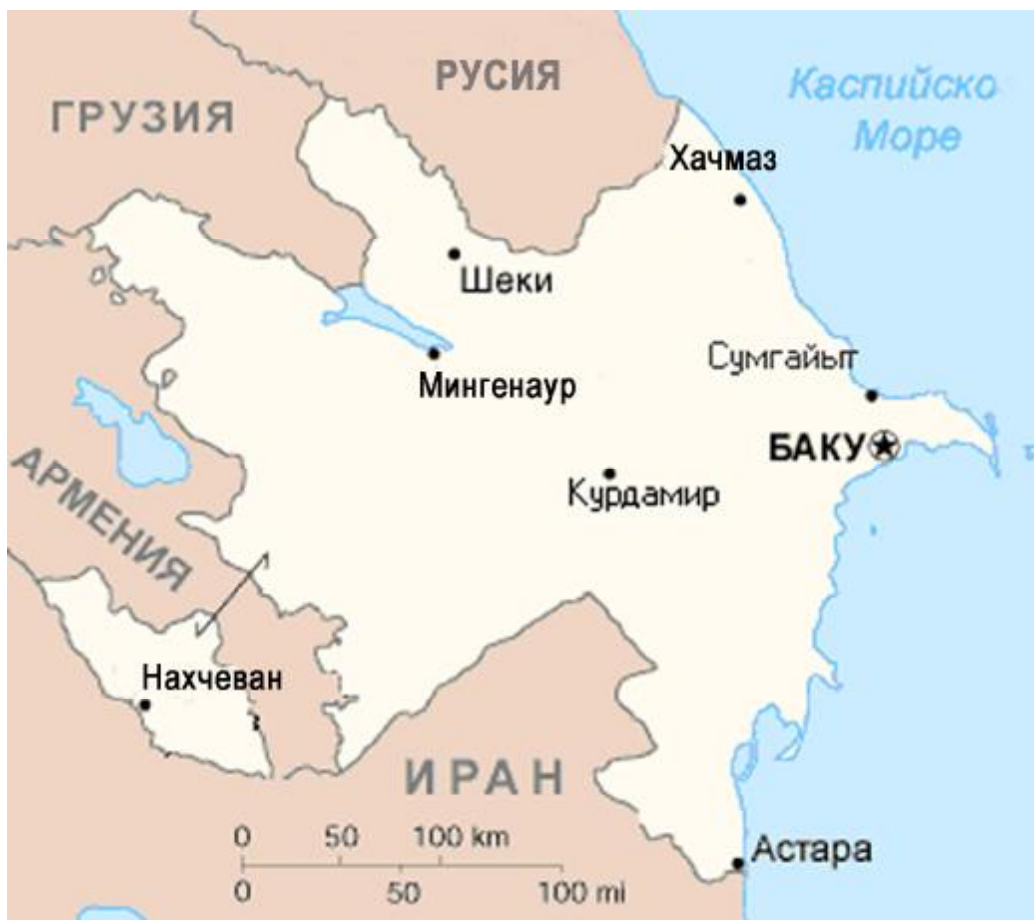
Карта на Азербайджан