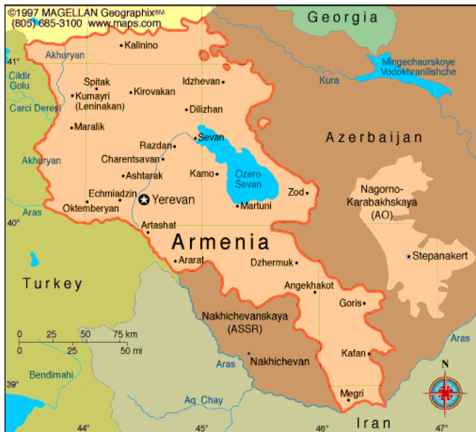
Карта на Армения