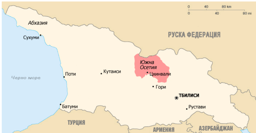
Карта на Грузия