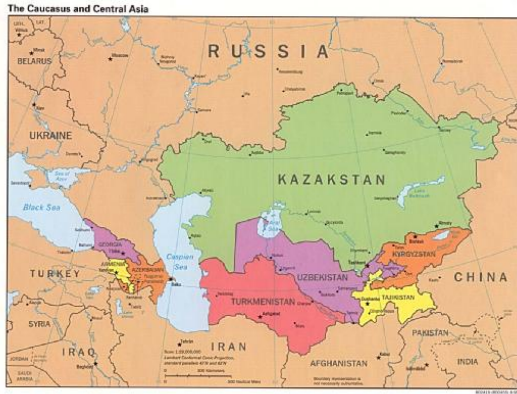
Карта на Евразия